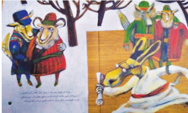
تصویر ۳- این همانی، ۱۳۸۴، فریده خلعتبری