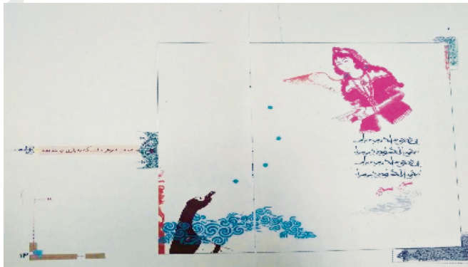
تصویر ۴- جمشید و خورشید، ۱۳۸۶، فریده خلعتبری

رابطه ترکیبی با تعداد ۱۰ در پنج داستان مشاهده شده است. نتایج حاصل از بررسی حاکی از آن است که رابطه ترکیبی در متن و تصویر به لحاظ تعداد سومین رابطه است. در همه کتاب‌ها این رابطه به درستی و با تعداد متناسب به کار برده شده است، مثلاً در کتاب پیشی و موشی با گروه سنی (الف، ب) رابطه ترکیبی به صفر رسیده است.